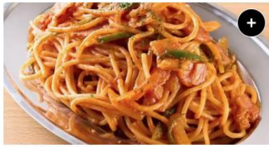
神田ナポリタン Kanda Napolitan ¥1,200 ¥1,500