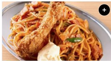
海老フライ&ナポリタン Deep Fried Shrimp&Napolitan ¥1,650 ¥2,062