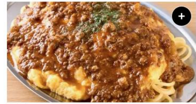
オム&ミートソース Omelette Meat Sauce ¥1,450 ¥1,812