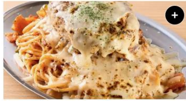
炙りチーズハンバーグ&ナポリタン Grilled Cheese Hamburg steak&Napolitan ¥1,850 ¥2,312