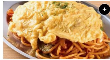
オム&ナポリタン Omelette Napolitan ¥1,450 ¥1,812