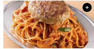
ハンバーグ&ナポリタン Hamburg steak&Napolitan ¥1,650 ¥2,062