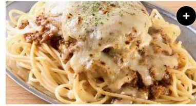
炙りチーズハンバーグ&ミートソース Grilled Cheese Hamburg steak&Meat Sauce ¥1,850 ¥2,312