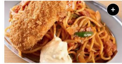
カニクリーム&ナポリタン Crab Creamy Croquette&Napolitan ¥1,490 ¥1,862