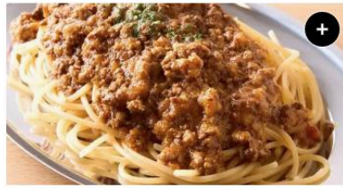
ミートソース Meat Sauce ¥1,200 ¥1,500