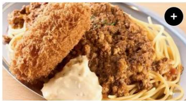
カニクリーム&ミートソース Crab Creamy Croquette&Meat Sauce ¥1,490 ¥1,862