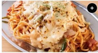
炙りチーズ&ナポリタン Grilled Cheese&Napolitan ¥1,390 ¥1,737