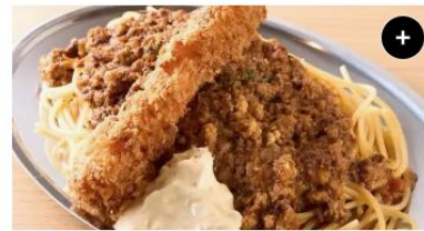
海老フライ&ミートソース Deep Fried Shrimp&Meat Sauce ¥1,650 ¥2,062