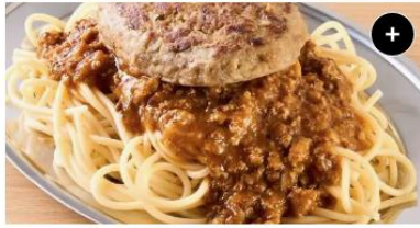
ハンバーグ&ミートソース Hamburg steak&Meat Sauce ¥1,650 ¥2,062