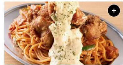
タルタルチキン&ナポリタン Tartar Chicken&Napolitan ¥1,650 ¥2,062