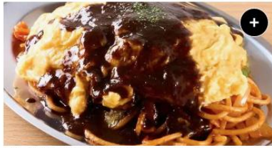
オムハヤシ&ナポリタン Omelette Napolitan ¥1,540 ¥1,925