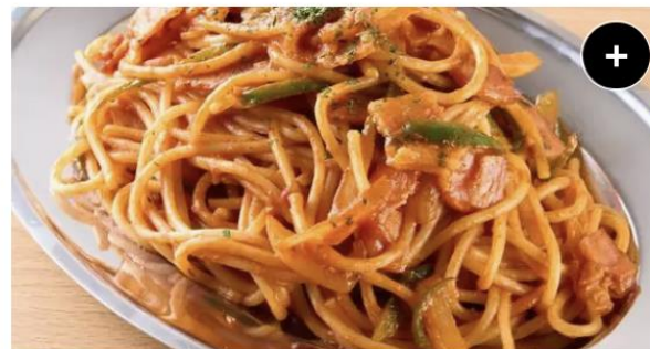
神田ナポリタン Kanda Napolitan